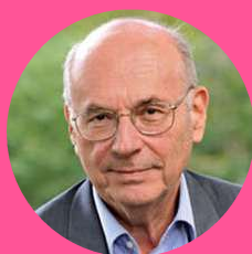
BORIS CYRULNIK NEUROPSYCHIATRE