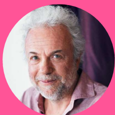
FRÉDÉRIC LENOIR PHILOSOPHE